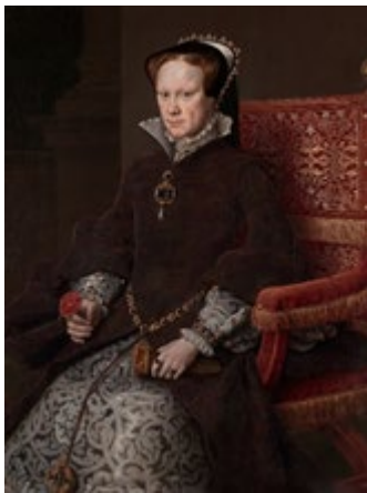
Bloody Mary 1553 – 1558