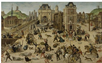
St Bartolomeus-dag-slagting 23 – 24 Augustus 1572

Johannes 16:33 Dit het Ek vir julle gesê, dat julle in My vrede kan hê. In die wêreld sal julle verdrukking hê; maar hou goeie moed, Ek het die wêreld oorwin.